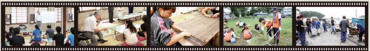
夏合宿のボランティア活動を激励に学長訪問 (2013年8月気仙沼市唐桑町)