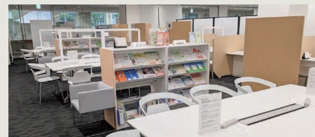
土樋キャンパス就職キャリア支援課 資料コーナー

本学学生の採用意欲がある企業が、企業セミナーをオンラインにて開催します。企業情報の提供はもちろん、対話や質疑応答を重視し、学生と企業のより良いマッチングにつながることをめざしています。