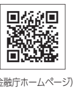
(金融庁ホームページ)