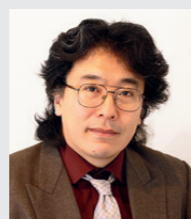
主要研究分野 / 日本倫理思想史

大学時代は、大人として成長し社会に出るための大切な時期です。職業的なスキルを身につけることよりも、自分自身を見つめ直し、人生の基本方針を形成することに力を注いでほしいと思います。私が担当する日本思想・東洋思想関連の科目は、日本人としての自分の土台をきちんと学び直し、自分の生き方を見つめるのに役立つものとなるでしょう。