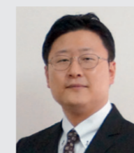
主要研究分野 / アメリカ・キリスト教史、アメリカ文化

中国との貿易摩擦、COVID-19の拡大、BLM(Black Lives Matter)運動、そして大統領の交代に伴う混乱など、アメリカ社会は、これまでにない転換期を迎えています。日本は、経済、政治、文化に至るまでアメリカと深い結びつきを持っています。そのため、アメリカについて理解を深めることは今後ますます重要になっていくでしょう。総合人文学科ではアメリカ文化の根底にあるキリスト教をはじめとして、アメリカ文化について幅広く学ぶことができます。