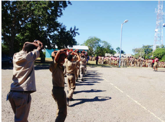
小学校での避難訓練

いのではないか。」という不安がありました。しかし仮設商店街の方々には、私たち学生のことを優しく迎えてくださり、震災当時の状況や各店舗の苦労などを嫌な顔をせずに丁寧にお話ししてくださいました。また困難な状況下であっても利益が出るように、どの店舗も工夫を凝らしていて、商売に対する誇りと強い思いを感じました。その後、調査結果のグラフや表、地図を作成し、聞き取り内容をまとめて報告書を発行したとき、一つのことをやり遂げた大きな達成感を得ることができました。この体験から、私は少しでも本音に近いことを聞き出すためには「現地へ行き、直接その土地の人たちにとって話を聞くのが最良の方法だ。」ということ学びました。復興調査だけでなく、岩動先生のご紹介で秋田県大仙市観光協会が主催する行事に参加し、酒蔵見学や郷土料理の創作体験もしました。夜には日本三大競技花火大会の一つである「大曲の花火」を主催する煙火業者が打ち上げる花火大会を鑑賞しま